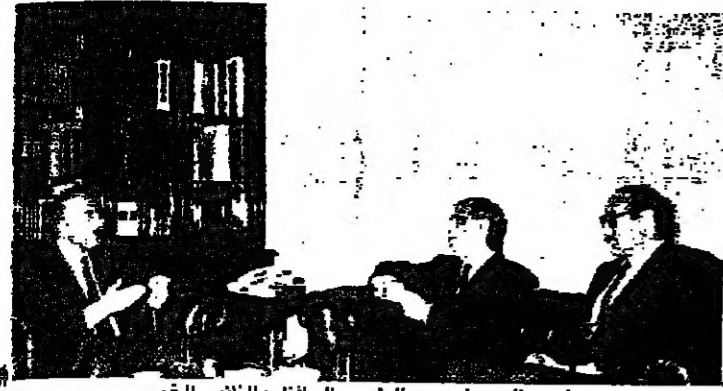
الرئيس الحسيني مع الرئيس المحافظ والنائب الخري